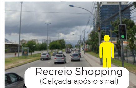
Recreio Shopping (Calçada após o sinal)