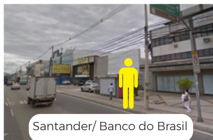
Santander/ Banco do Brasil