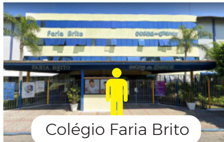
Colégio Faria Brito